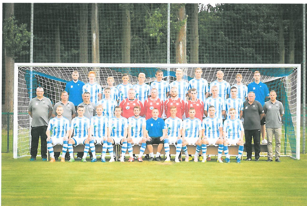
Fot. Pierwsza drużyna OKS Świt, sezon 2015/2016, 3 liga bałtycka